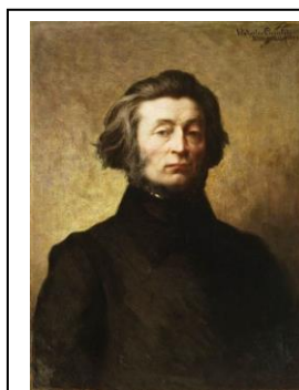
Adam Mickiewicz (1798–1855) – jeden z najwybitniejszych poetów polskich, działacz polityczny, publicysta.

Moskwa mnie uważała gwałtem za stronnika, Dano Soplicom znaczną część dóbr nieboszczyka, Targowiczanie potem chcieli mnie zaszczyścić Urzędem. Gdybym wtenczas chciał się przemoskwicić!