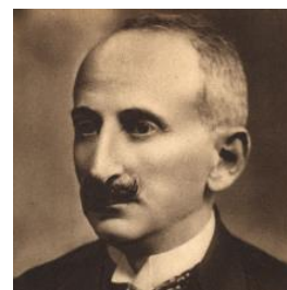
Bolesław Leśmian (1877–1937) – poeta, prozaik, eseista, krytyk literacki, czołowy przedstawiciel literatury dwudziestolecia międzywojennego.

Kroki moje już dudnią po grobli – nad rzeką. Słysząc je tak daleko! Tak cudnie daleko! A teraz – bieg z powrotem do domu – przez trawę – I po schodach, co lubią biegnących stóp wrzawę... I pokój, przepelniony wiosną i upałem, I tym moim po kątach rozwłóczonym ciałem – Dotyk szyby – ustami... Podróż – w nic, w oszklenie – I to czujne, bezbrzeżne z całych sił – istnienie!